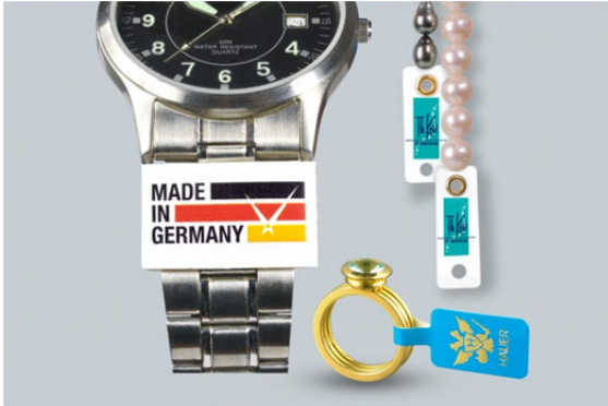
Abb.1: Marken-Etiketten mit individuellem Logo aus der eXtra4-Produktion