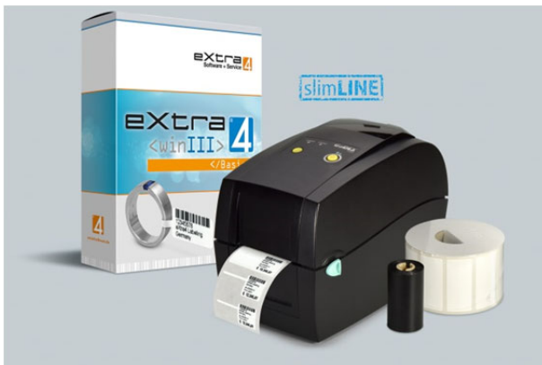
Abb.3 Das Angebot von eXtra4: Etikettier-Systeme aus einer Hand