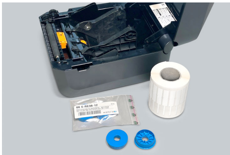
Abb.1: Neu von eXtra4 Labelling Systems: Rollenkerne-Adapter zur Verbesserung der Druckpräzision von Thermotransfer-Druckern.