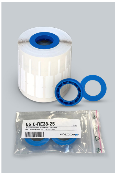
Abb.5: Rollenkern-Adapter für 1,5“-Rollenkerne mit Reduktion auf 1,0“- Rollenhalterung im Drucker