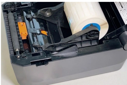
Abb.3: eXtra4-Rollenkerne-Adapter in eingebautem Zustand.