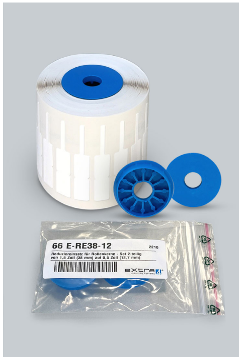
Abb.4: Rollenkern-Adapter für 1,5“-Rollenkerne mit Reduktion auf 0,5“- Rollenhalterung im Drucker