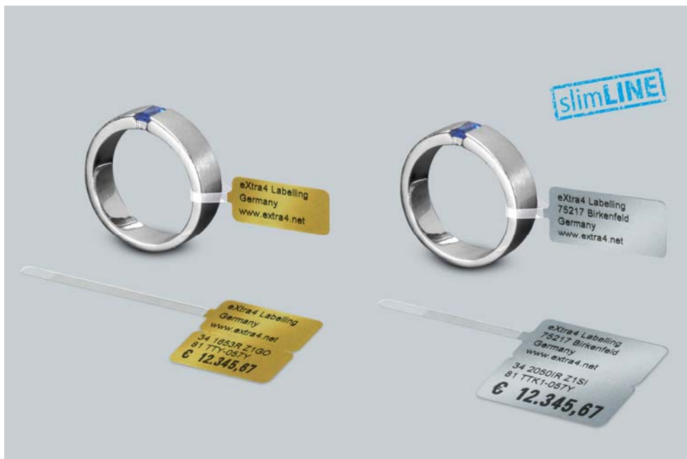
Abb.2: „slimLINE“-Schmucketiketten mit transparenter Schlaufe in goldmetallic, Größe, Small, Ref-Nr. 34 1653R Z1GO und silbermetallic, Größe Standard, Ref-Nr. 34 2050IR Z1SI, Druckbild des „slimLINE“-Druckers Godex RT230 mit 300 dpi.