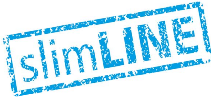
Abb 3: „slimLINE“ - günstiger Etikettendruck für Einsteiger von eXtra4 Labelling Systems