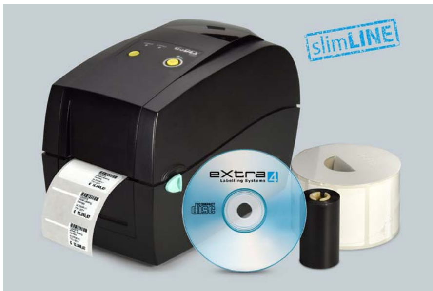
Abb. 4: „slimLINE“-Einsteigerpaket mit Etikettendrucker Godex RT200, Etikettendruck-Software eXtra4, Schmucketiketten und Farbband