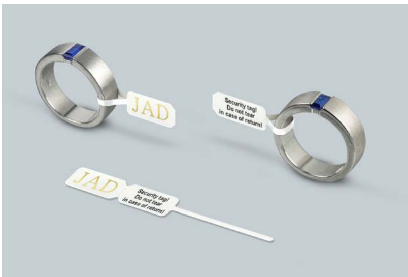
Abb.1: Individuell gestaltetes Sicherheitsetikett von eXtra4 als Guard-Label in Form eines Schlaufen-Etiketts, Ref.-Nr. 34 870, mit Metallic-Druck und Warnhinweis