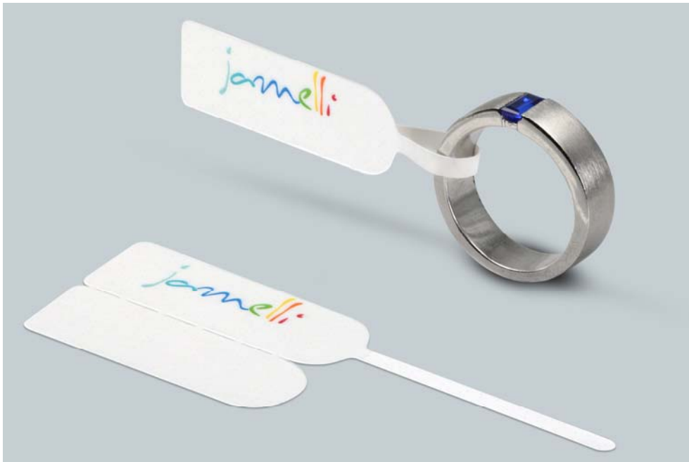
Abb.3: Schlaufen-Etikett in Sonderform, mit Schriftzug in digitalem 4-Farb-Druck von eXtra4 Labelling Systems