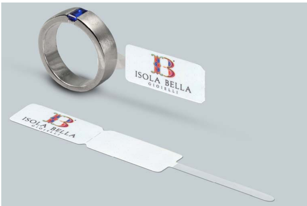
Abb.2: Schmuck-Etikett, Schlaufe transparent, digital gedruckt mit 4-Farb-Motiv bei eXtra4 Labelling Systems