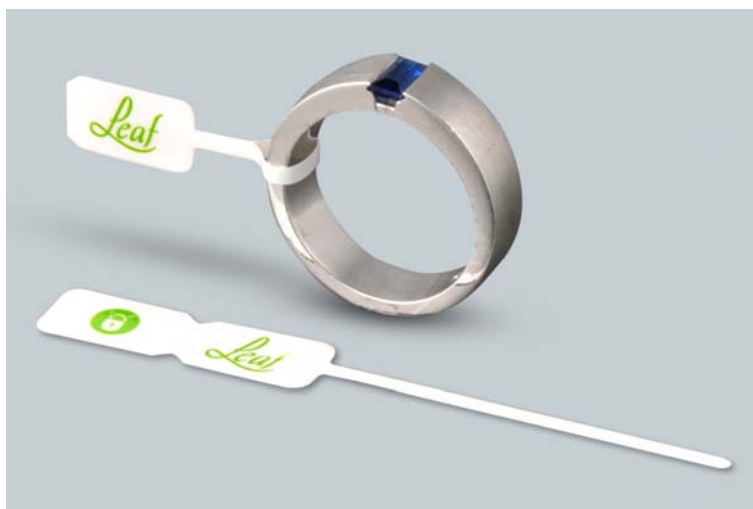
Abb.4: Selbst kleinste Etiketten eignen sich als Kombination aus Sicherheitsetikett und Marken-Siegel