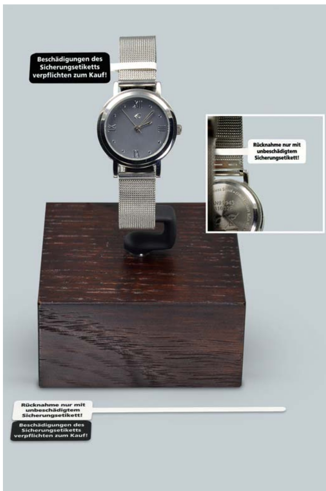
Abb.3: Sicherheitsetikett mit eindeutiger Aussage